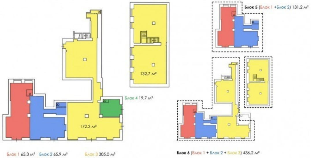
ВОЗМОЖНО ОБЪЕДИНЕНИЕ БЛОКОВ