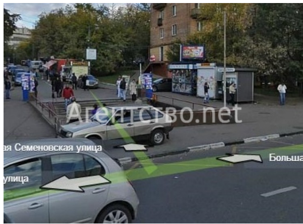
Схема благоустройства территории