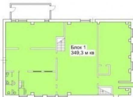
ПЛАН 1 ЭТАЖА БЛОКИ