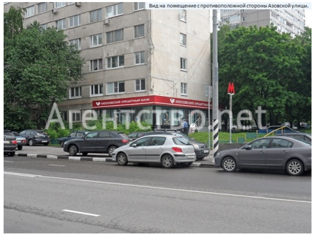
Вид на помещение с противоположной стороны Азовской улицы.