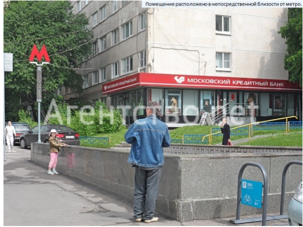
Помещение расположено в непосредственной близости от метро.