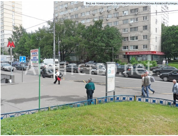
Вид на помещение с противоположной стороны Азовской улицы.