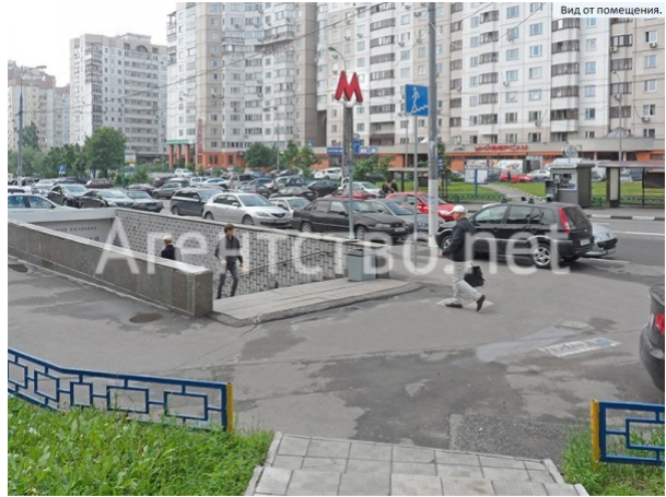
Вид от помещения.