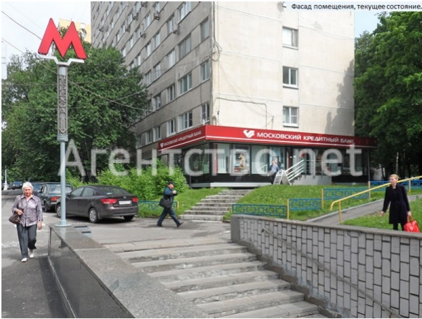
Фасад помещения, текущее состояние.