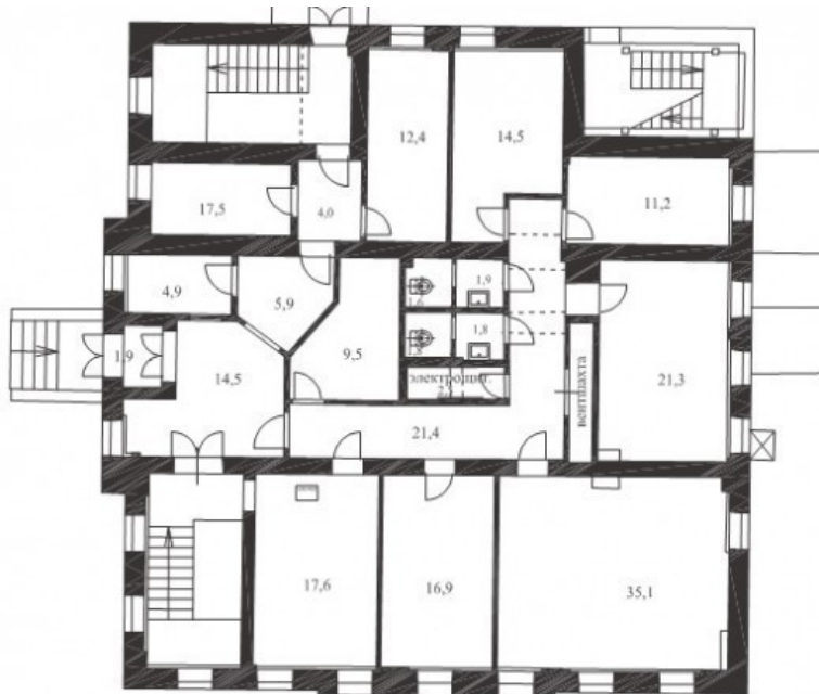
1 этаж 243,5 кв. м (по БТИ)