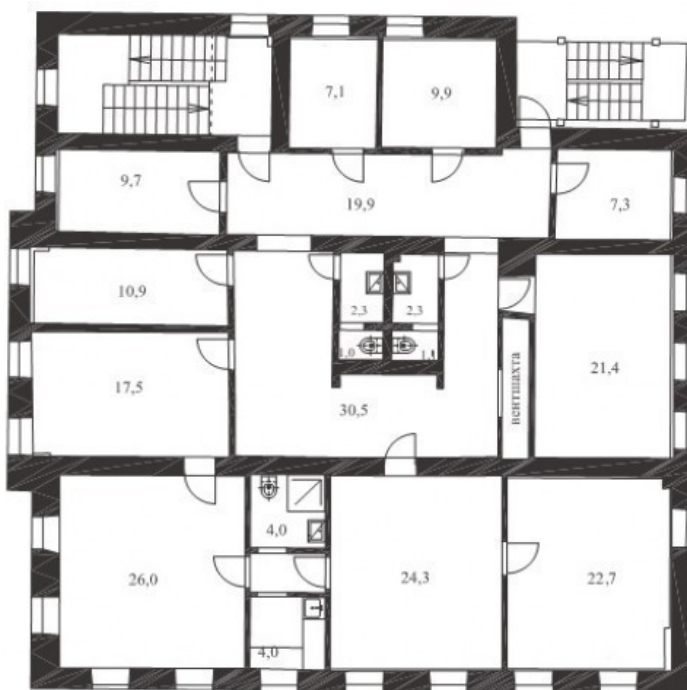
2 этаж 242,9 кв. м (по БТИ)