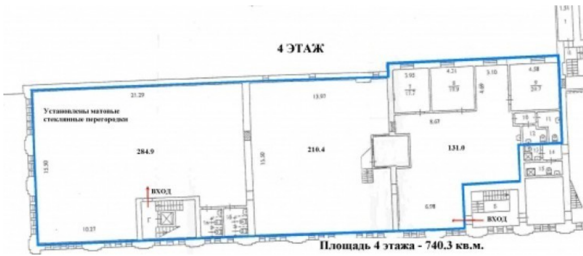
Площадь 4 этажа - 740.3 кв.м.