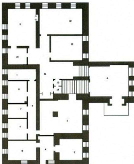
План 1-го этажа Общая площадь 260,8 кв. м.