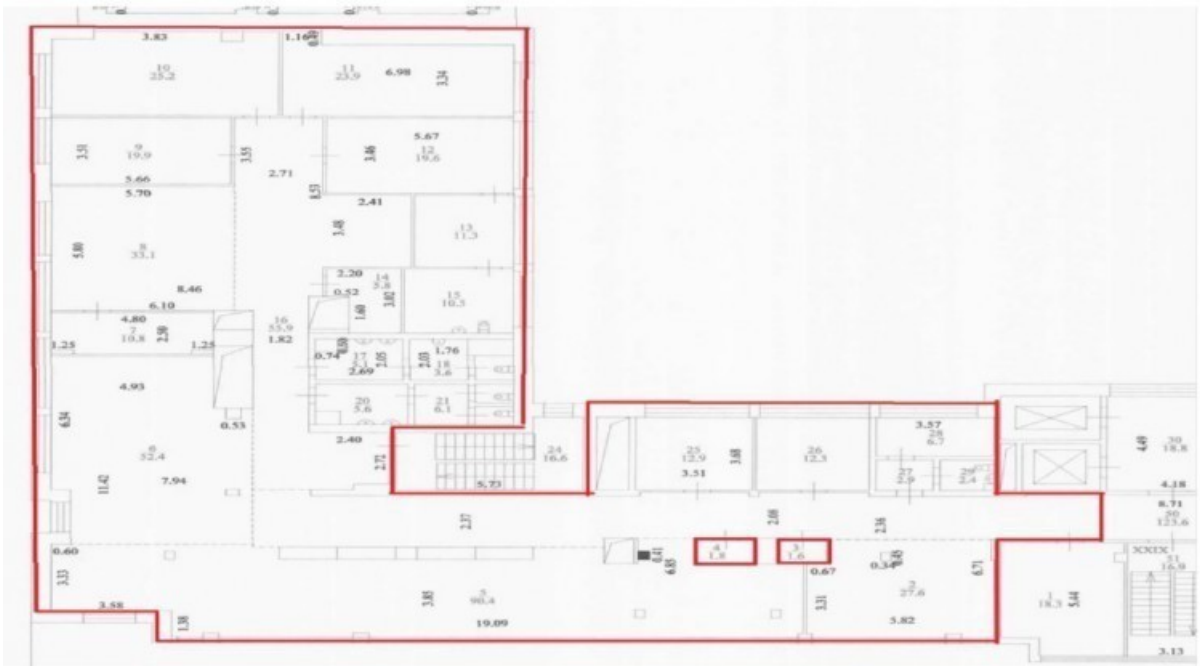
План 5 этажа